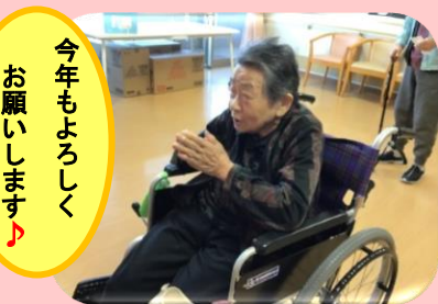
今年もよろしく お願ひします