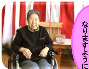
良い年に なりますように