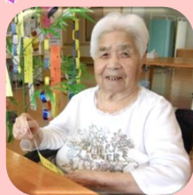
願い事叶うかなあ〜

七月七日、一年に一度だけ、織り姫と彦星が逢える日です。皆様の願い事は「美味しいものが食べたい。」「旅行に行きたい。」「家族に会いたい。」「短冊にいろいろな願い事を書きました。今日のお昼はどうですか?おやつは?素敵ですね、七夕がいっぱいです。笑顔で美味しそうに、召し上がりました。職員もその笑顔が大好きです。これからも皆様と楽しい行事を計画していきます。待っていて下さい。暑い夏。体につけて過ごしましょ。