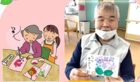
上手に書けました☆